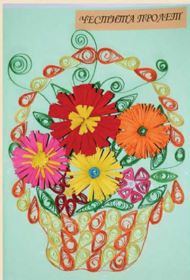
Квиллинг изкуство от децата в Дома в гр. Якоруда

Радост за колектива са всички възпитаници,